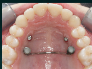
Skelettal verankerter TPA